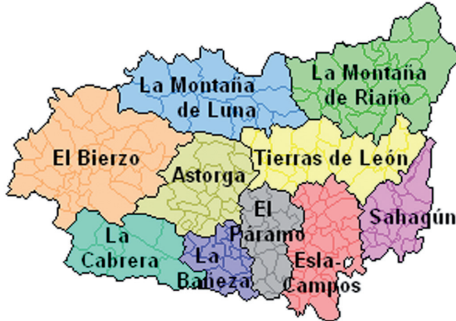
Figura 3.1: Mapa de Comarcas

La división comarcal adoptada para el presente estudio podría haber sido más puntual o también más genérica, habiéndonos decantado por la indicada en el mapa, precisamente por mantener cierto equilibrio entre las distintas opciones.