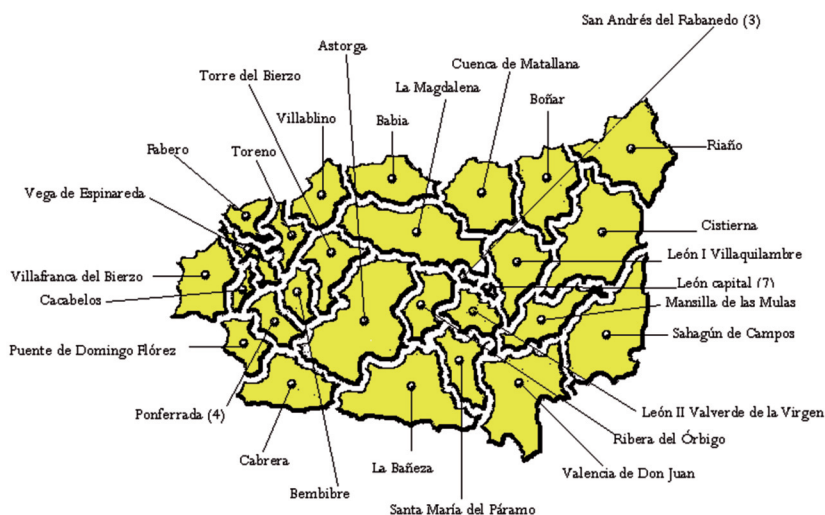
Figura 3.4: Zonas de Acción social de la provincia de León