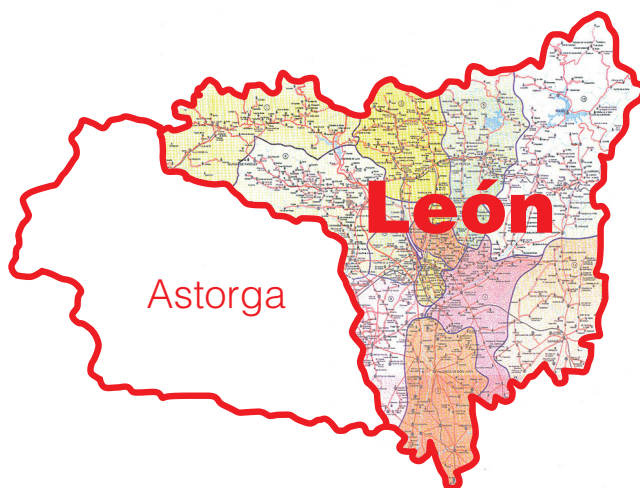
Figura 3.2: Distribución del territorio provincial por Diócesis